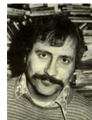
Le critique rock Lester Bangs