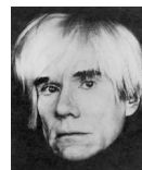
Andy Warhol (icône du Pop Art)