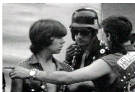
Les Hell's Angels « assurent » la sécurité à Altamont Speedway (1969)