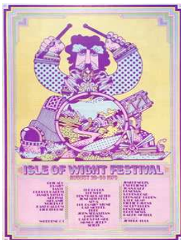
L'affiche du festival de l'île de Wight (1970) avec Hendrix, The Who, etc...