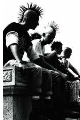
Le look « punk à crête »