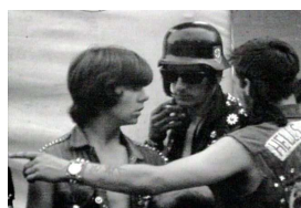
Les Hell's Angels « assurent » la sécurité à Altamont Speedway (1969)