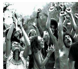
Festival de Woodstock (1969)