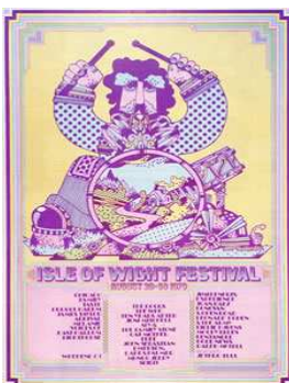
L'affiche du festival de l'île de Wight (1970) avec Hendrix, The Who, etc...