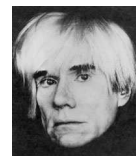
Andy Warhol (icône du Pop Art)