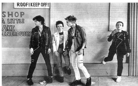
The Clash (Punk Rock—Angleterre)