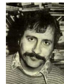
Le critique rock Lester Bangs