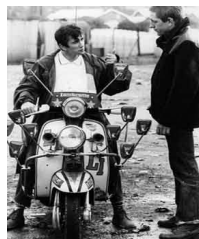
Les mods des 60's